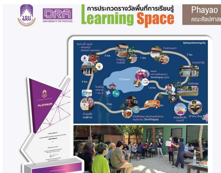
ภาพที่ 3.2 โครงการ Phayao Learning City ได้รับรางวัลระดับ Platinum รางวัลสนับสนุนพื้นที่การเรียนรู้ 69